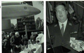
DV 07: Ausgewählter organisiert vom OK der Sektion Waldstätt Eccellente organisation de l'AD par le CO de la section Waldstätt DV 07: Ausgewählter vom der TK für die Tagung 2006 Sektion Wand Distinction de la CT pour les activités hors service 2006 section Wand, 133 ps

DV 07: Das Wichtigste in Kürze Jahresbericht 2006 des Zentralpräsidenten WIR SUCHE: Zentralsekretär, Webmaster >>Seite 2 Sektionsnachrichten Rapport annuel 2006 58 e Assemblée des délégués, Lucerne, 28 avril 2007 Conférence des présidents, Berne, 24 février 2007 Qu'est-ce que la CNAM?